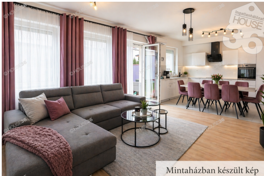
Mintaházban készült kép